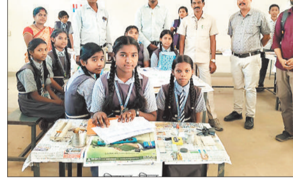
उपस्थित अतिथि, शिक्षक एवं मॉडल का प्रदर्शन करते बच्चे।

हरिभूमि न्यूज ▶▶ बिरा राष्ट्रीय शिक्षा नीति 2020 के अनुरूप अनुभवत्मक एवं प्रयोग आधारित शिक्षण को बढ़ावा देने के उद्देश्य से संकुल केंद्र डी डी एस बिरा के शासकीय पूर्व माध्यमिक शाला