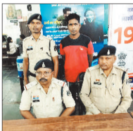
पुलिस के साथ गिरफ्तार आरोपी।