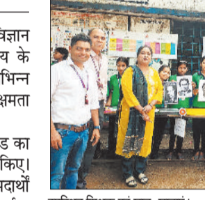
उपस्थित शिक्षक एवं छात्र-छात्राएं।

शासकीय प्राथमिक एवं पूर्व माध्यमिक शाला भवतरा में विज्ञान मेला का आयोजन किया गया। इस अवसर पर विद्यालय के विद्यार्थियों ने विभिन्न वैज्ञानिक मॉडलों एवं प्रोजेक्ट्स, विभिन्न प्रकार स्टालों में प्रयोग के माध्यम से अपनी प्रतिभा, नवाचार क्षमता और वैज्ञानिक सोच का उज्ज्वल प्रदर्शन किया।