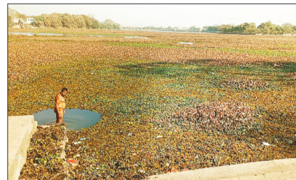
जलकुंभी व गंदगी से अटा पड़ा रामबांधा तालाब।

कारण यह सिकुड़ गया। वहीं गंदगी व जलकुंभी ने रही सही कसर पूरी कर दी। अब यह तालाब पूरी तरह से बढहाल हो चला है। रामबांधा तालाब का आइडीएसएमटी योजना के तहत गहरीकरण व सौंदर्यीकरण का कार्य कुछ सालों पहले शुरू हुआ।