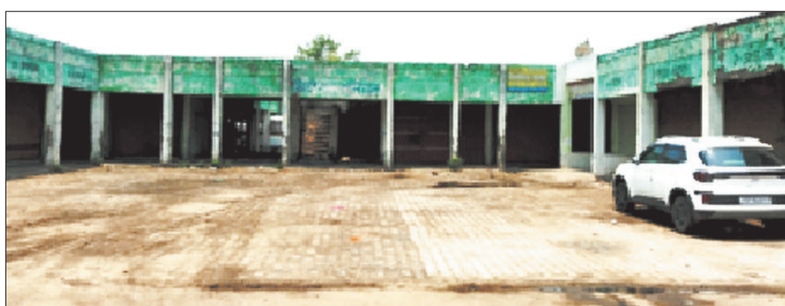
वीरान पड़ा नैला बस स्टैण्ड।

शहर के अंदर लाखों की लागत से बना नैला बस स्टैण्ड वीरान पड़ा हुआ है। साथ ही साथ व्यवसायिक कॉम्प्लेक्स का उपयोग भी नहीं हो पा रहा है। देखा जाए तो यहां शाम के समय असामाजिक तत्वों का जमावड़ा लगा रहता है। ज्ञात हो कि जांजगीर नैला नगर पालिका परिषद क्षेत्र की नैला मुख्य मार्ग में कुछ असें पूर्व बस स्टैण्ड का निर्माण किया गया था, जिसमें व्यवसायिक कॉम्प्लेक्स भी बनाया गया था। परिसर आज जर्जर की स्थिति में है। बस स्टैण्ड निर्माण के शुभारंभ करने के साथ परिसर में बने दुकानों को आर्बिटि भी कर दिया गया, किंतु कुछ समय तक सिटी बसों की परिचालन करने के बाद स्टैण्ड को बंद कर दिया है और वहां न तो मार्ग में आवागमन करने के लिए यात्री गाड़ियां पहुंच रही हैं और न ही आर्बिटि दुकानें खुल रही हैं। दूसरी तरफ स्टैण्ड की पिछले तरफ की दीवाल भी असामाजिक तत्वों ने तोड़ दिया है और वहां व्यवसायिक उपयोग न होकर शाम के समय