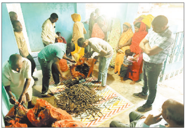
लाख पालन का प्रशिक्षण लेते किसान।

लाख से प्राप्त राल के हानि रहित गुणों के कारण इसका महत्व रासायनिक यौगिकों के रालों से अधिक है। लाख कीटों द्वारा उत्पादित राल से लाख एवं इसके अतिरिक्त मोम और सुन्दर लाल रंग सह उत्पाद के प्राप्त होते हैं,