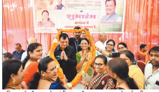
भूमिपूजन के दौरान उद्योग मंत्री व महापौर का स्वागत करते वार्डवासी।

दोनों ही कॉलोनी आज शहर के मुख्य आवासीय कॉलोनी हैं लेकिन यहां की सीवरेज लाइन की समस्या विगत कुछ वर्षों से बढ़हाल थी। कॉलोनी की लंबे समय से नई सीवरेज लाइन के निर्माण की मांग थी। विधानसभा चुनाव में जब मुझे आप सभी के बीच संवाद कर आशीर्वाद प्राप्त करने का अवसर मिला था तब आप सभी ने इस बहुप्रतीक्षित कार्य की मांग की थी। तब मैंने वादा किया था की नई सीवरेज लाइन का निर्माण हर हाल में किया जाएगा। आप सभी को बताते हुए हर्ष हो रहा है कि इस बहुप्रतीक्षित कार्य को लेकर मुख्यमंत्री विष्णुदेव साय और उपमुख्यमंत्री अरुण