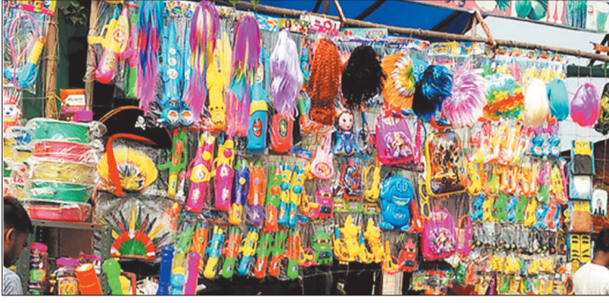
जिला मुख्यालय के कचहरी चौक पर सजा रंग-गुलाल व पिचकारी की दुकान।

रंगों का त्योहार होली बुधवार 4 मार्च को मनाया जाएगा। इसको लेकर रंगों का बाजार सज गया है। बाजार में एक से बढ़ कर एक पिचकारी दिखायी पड़ रही है। इस वर्ष बाजार में कैमिल रंग के साथ-साथ फूलों के पंखुडियों से बनने वाले रंग की मांग ज्यादा है। बाजार में रंग-अबीर, पिचकारी के साथ-साथ आकर्षक मुखौटे भी दिखायी पड़ रहे हैं। इस बार बाजार में कई प्रकार की डिजाइन वाली पिचकारी उपलब्ध है। इसकी कीमत 40 रुपये से 350 रुपये तक है।